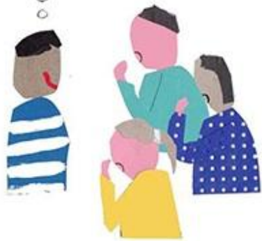
iedereen hoort wat je denkt