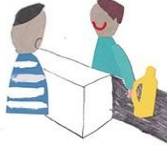
jij hoort wat iedereen denkt

Jij zult ook wel eens voor lastige keuzes staan. Je moest kiezen tussen twee dingen. Bijvoorbeeld wel of niet naar een feestje gaan, omdat je eigenlijk nog moet leren voor een belangrijke toets? Of dat je wel of niet een geheim door moet vertellen. Als je twijfelt over de keuze die je moet maken dan noemen we dat een dilemma. Noteer hieronder een dilemma die je zelf hebt meegemaakt.